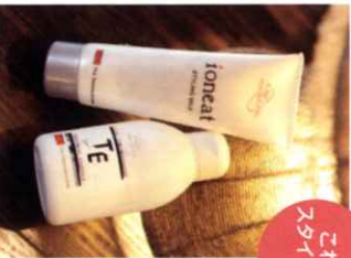
これでスタイリング

左から、コシのない髪にボリューム感を出すイオニートスタイリングミルク120g 1,995円、髪に栄養を与えるネスサヘアトリートメント エッセンス(枝毛・ダメージヘア用)200g 3,570円。