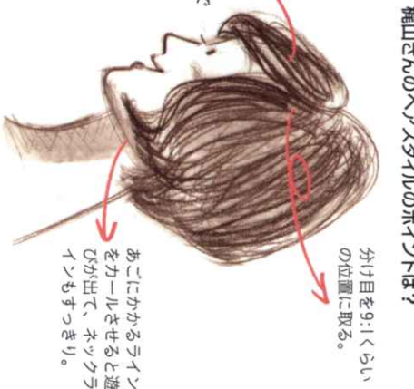
梶山さんのヘアスタイルのポイントとは？

ともに3人の子どもを持つ母親同士。家庭のこと、趣味のこと、好きなアイテムのこと……。話したすと止まらない。